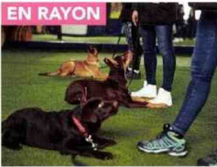
MARCHÉ DÉDIÉ À L'ÉDUCATION