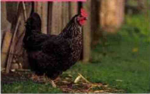
POULE DE COMPAGNIE