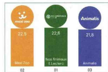
1. Top 3 des enseignes d'animalerie les plus attractives.

Sur le secteur de l'animalerie, 9 enseignes ont été évaluées selon 11 critères comme la variété de l'offre, le rapport qualité-prix en passant par l'expérience d'achat en magasin. 2941 personnes ont répondu sur la partie concernant ce secteur. C'est l'enseigne Nos Animaux E.Leclerc qui se révèle la plus attractive dans cette catégorie Animalerie avec un indice de 22,6 (Fig. 1). En deuxième position, on trouve Maxi Zoo avec